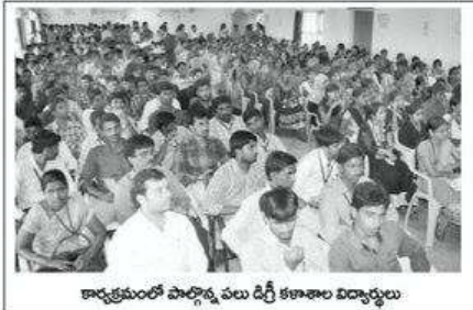
కార్యక్రమంలో పాల్గొన్న పలు డిగ్రీ కళాశాల విద్యార్థులు

• హాజరైన రాయలసీమ 30 డిగ్రీ కళాశాల విద్యార్థులు